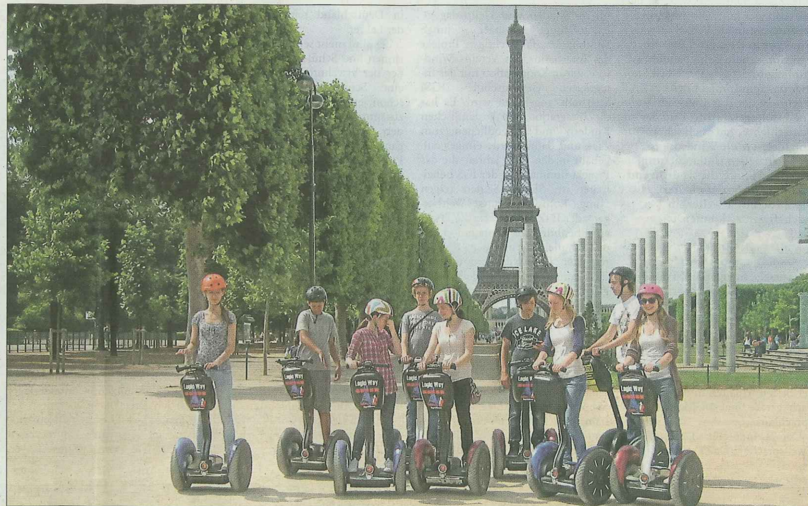
Schüleraustausch: Junge Friedrichsdorfer und ihre französischen Gastgeber erkundeten Paris per Segway. Wer dieses Jahr dabei sein möchte, sollte sich schnell beim Städtepartnerschaftsverein anmelden.

Im April startet der deutsch-französische Schüleraustausch für junge Leute (12 bis 18 Jahre). Vom 11. bis 20. April werden die Friedrichsdorfer in Houilles sein. Vom 22. bis 31. August sind die jungen Franzosen in Friedrichsdorf zu Gast. Auf dem Programm steht das gemeinsame Entdecken von Friedrichsdorf und Umgebung sowie von Houilles und Paris. Anmeldung ab sofort bei